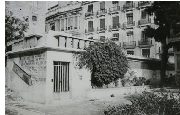
Refugios antiaéreos en la Plaza del Patriarca y en la Plaza de la Virgen de Valencia, actualmente demolidos.