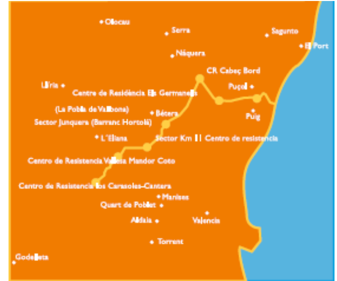
Trazado aproximado de la Línea El Puig – Cara-sols.

El valor cultural de los restos se podría integrar junto a los valores naturales de los parajes en los que se encuentran en algunos tramos del trazado de la línea.