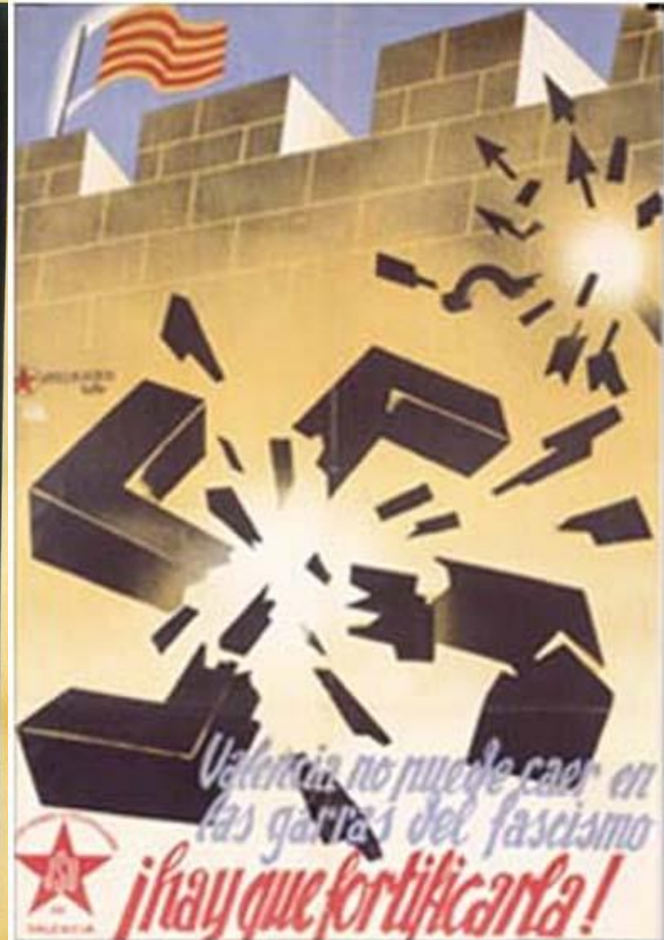
Carteles de la época animando a alistarse para la construcción de la Línea El Puig – Cara-sols.